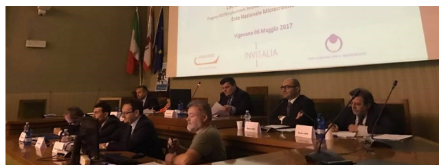
Un momento dell'incontro presso la Sala consiliare.

Si è tenuto sabato 6 maggio presso la sala consiliare del Comune di Vigevano il convegno “La retemicrocredito per il microcredito e l'autoimpiego dei giovani” , promosso e organizzato dall'Ente Nazionale per il Microcredito in collaborazione con il Comune di Vigevano.