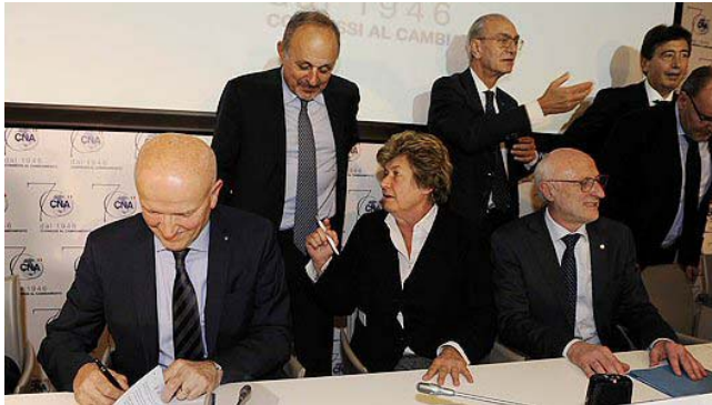
Le Parti Sociali alla firma dell'accordo.

Lo scorso 23 novembre a Roma i vertici delle Confederazioni dell'artigianato delle Pmi – Confartigianato Imprese , Cna, Casartigiani, Clai – e di Cgil, Cisl e Uil hanno firmato l'accordo per la riforma del modello contrattuale e sulla rappresentanza.